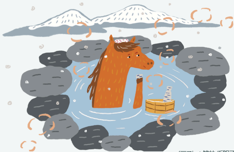
イラスト：笠井千賀子

近年増えている無人の棟貸しの宿は便利さの一方で、人との関わりが薄れがちです。誰かと出会い、どんな話を聞けるかが、旅の印象を大きく左右することもあります。