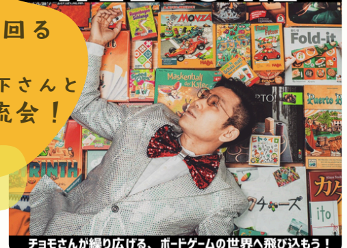
チョモさんが繰り広げる、ボードゲームの世界へ飛び込もう！

郡上市への移住を考えている方や、移住された方をサポートする郡上市の移住相談窓口「ふるさと郡上会」です！