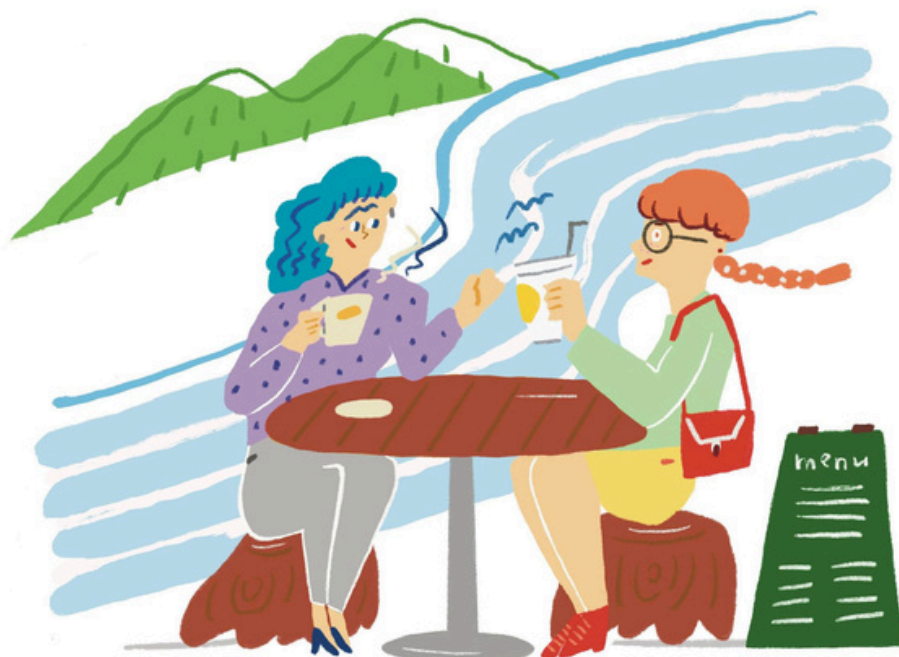
イラスト：笠井千賀子