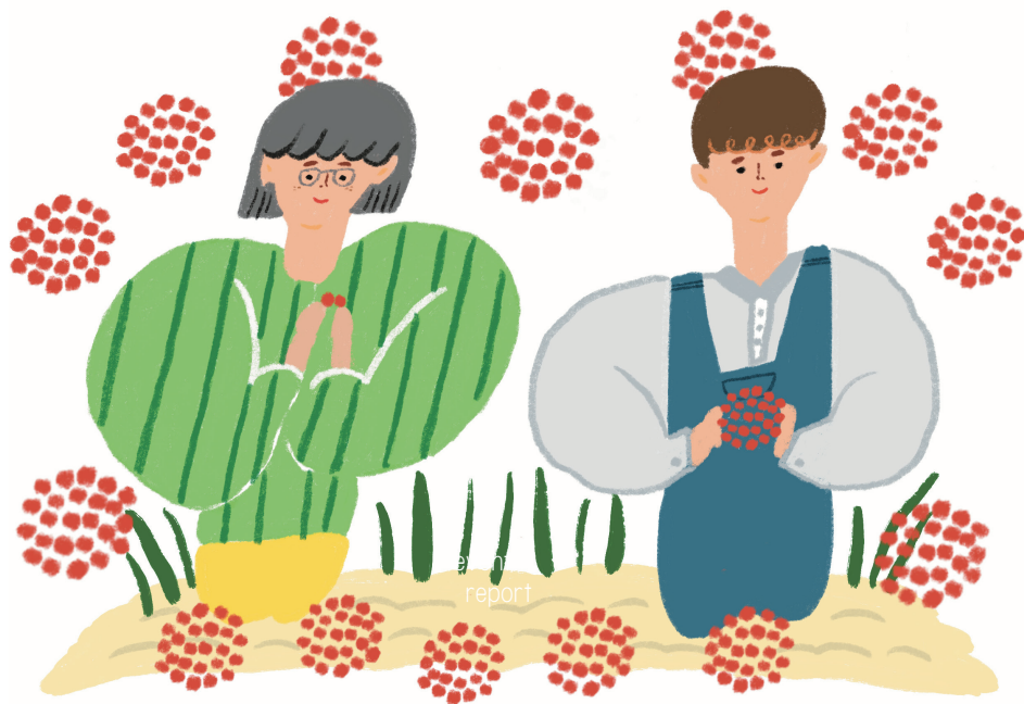
イラスト：大坪 千賀子