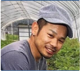
キャッチコピー・座右の銘