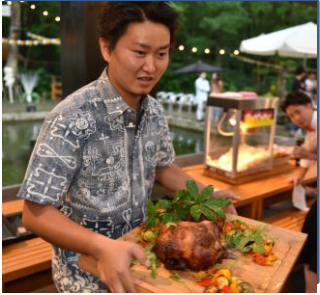
キャッチコピー・座右の銘