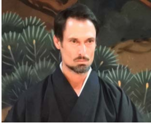
キャッチコピー・座右の銘

“It’s necessary to travel. It’s not necessary to live.”