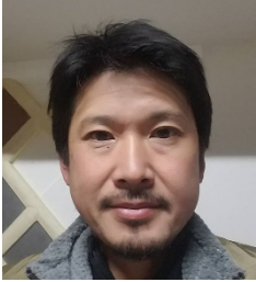
キャッチコピー・座右の銘