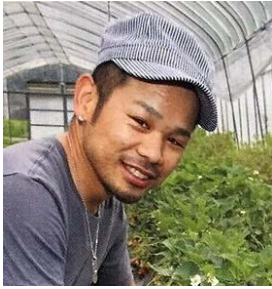
キャッチコピー・座右の銘