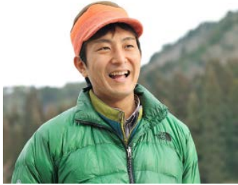
キャッチコピー・座右の銘